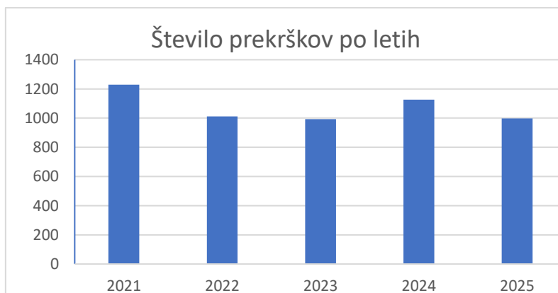
Tabela 2: gibanje števila prekrškov po letih